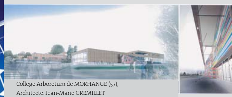
Collège Arboretum de MORHANGE (57), Architecte: Jean-Marie GREMILLET