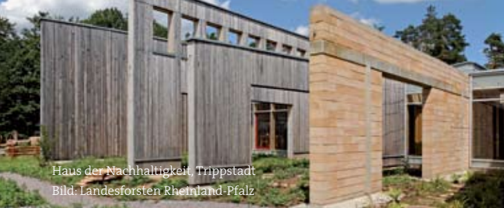
Haus der Nachhaltigkeit, Trüppstadt